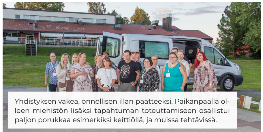
Yhdistyksen väkeä, onnellisen illan päätteeksi. Paikanpäällä olleiden miehistön lisäksi tapahtuman toteuttamiseen osallistui paljon porukkaa esimerkiksi keittiöllä, ja muissa tehtävissä.