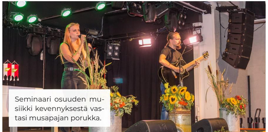
Seminaari osuuden musiikki kevennyksestä vastasi musapajan porukka.