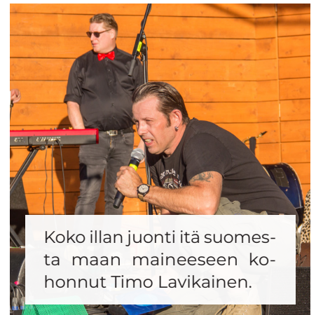
Koko illan juonti itä suomesta maan maineeseen kohonnut Timo Lavikainen.