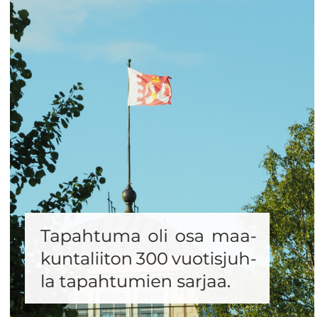
Tapahtuma oli osa maakuntaliiton 300 vuotisjuhla tapahtumien sarjaa.