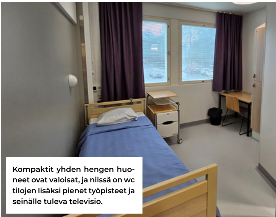
Kompaktit yhden hengen huoneet ovat valoisat, ja niissä on wc tilojen lisäksi pienet työpisteet ja seinälle tuleva televisio.

Siun SOTE POHJOIS-KARJALAN HYVINVOINTIALUE