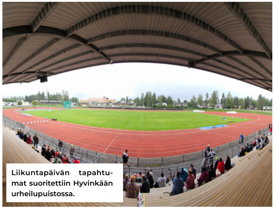
Liikuntapäivän tapahtumat suoritettiin Hyvinkään urheilupuistossa.