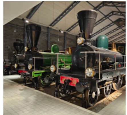
Riihimäen rautatiemuseossa tuoksui vanhan ajan rasva jolla vetureita pidetään kunnossa.