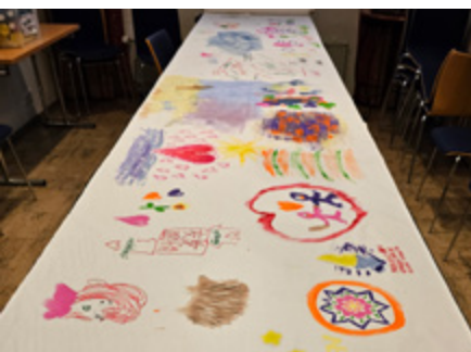
Yhdistyspäivien taidepajoissa tehtiin taidetta eri menetelmin.