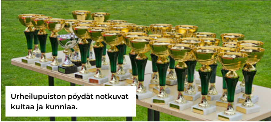
Urheilupuiston pöydät notkuvat kultaa ja kunniaa.